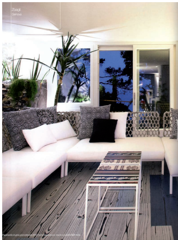
160 Angelo Pozzoli