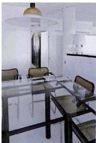
LE SEDIE CESCO S 64 DI MARCEL BREUER (THONET GERMANY), IN ACCIAIO, FAGGIO E PAGLIA DI VIENNA, SONO ABBINATE A UN TAVOLO DI CRISTALLO. IL TOP CURVO DEL BANCONCONE IN RESINA NERA È OPERA DI HD HOME DESIGN .