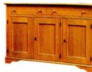
Credenza a tre ante in abete massello verniciato all'acqua di De Baggis. Disponibile anche con alaina sagomata, misura cm 155x48x91 h e costa 2.258 euro.

Arredi e muri coperti con patine colorate, una sedia da giardino e qualche cuscino ricamato: per ritrovare lo stile di questa casa.