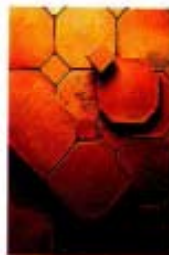
Il cotto artigianale "Artic" di Ceramiche Alberti è esteticamente simile ai cotti di recupero. In diversi formati, ottagonale cm 28x28 con smaltato quadrato, 11,25 euro/mq.