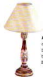
Abon-pur in stile con piede lavorato in ferro battuto e paralume in soffiata bianca della collezione Blom Home, 74 euro.